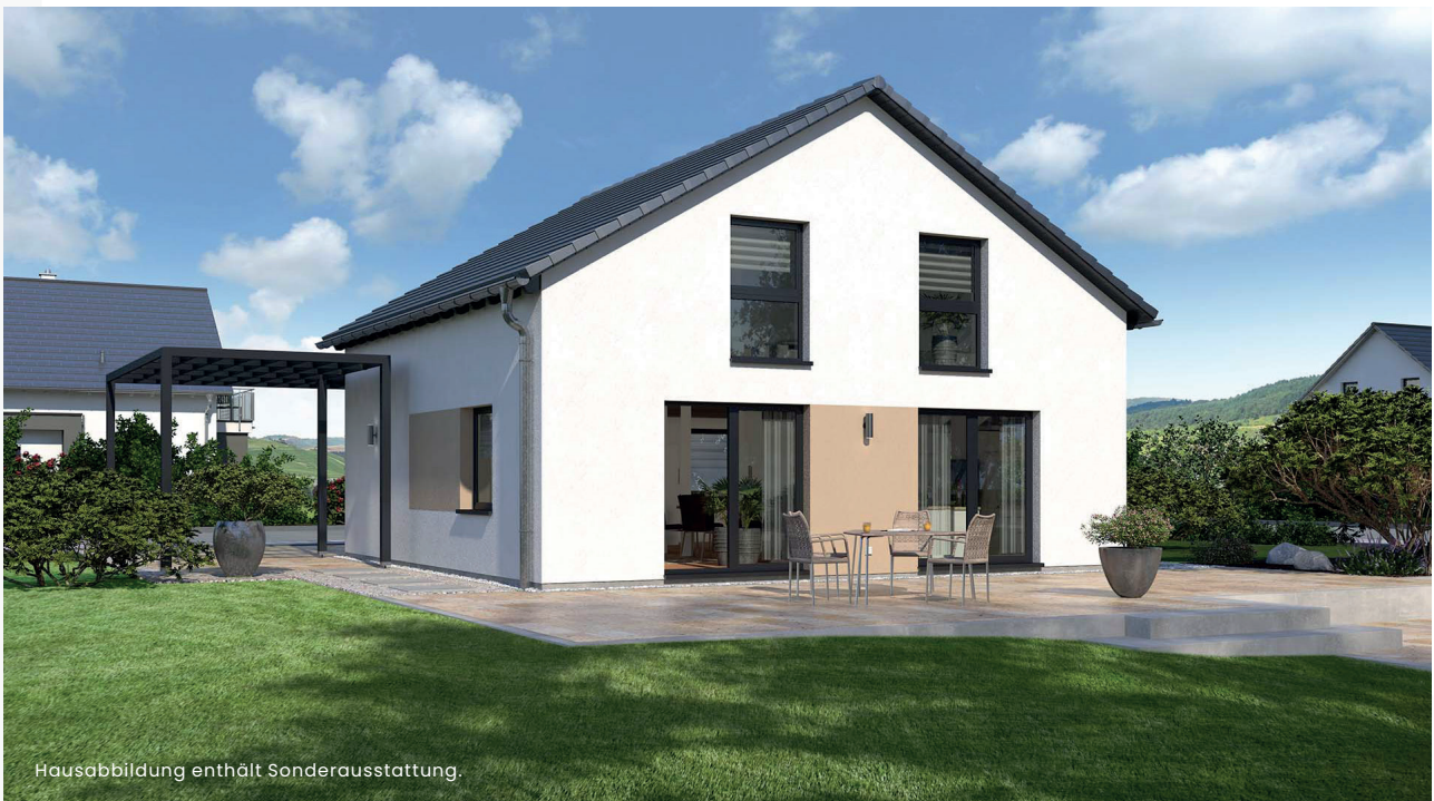
Hausabbildung enthält Sonderausstattung.

Fragen Sie nach unserer ausführlichen Bau- und Leistungsbeschreibung, um weitere Details zu erfahren.